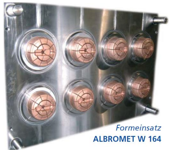
Formeinsatz ALBROMET W 164