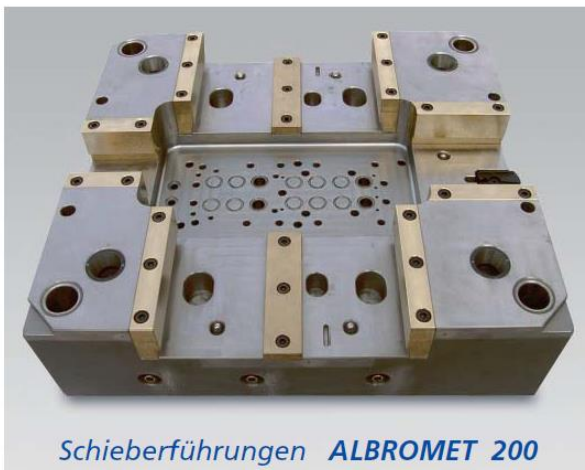
Schieberführungen ALBROMET 200

Anwendungen: Formeneinsätze, Formkerne, Heißkanaldüsen.